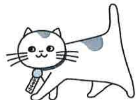
行政書士マスコット ユキマサくん